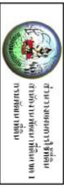
รูปที่ 3-3 แผนที่อาคารใช้ที่ดิน ตำบลบางตลาด อําเภองักกรัง จังหวัดนครพนม